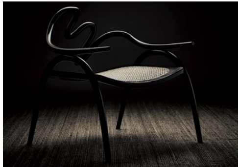
Armchair: ébonits, woven cane seat

日本人建築家・村上あずさと英国人アーティストのアレクサンダー・グロブスがロンドンで設立。文化的背景や素材に対する深い考察とイノベーターな提案が高く評価される。作品制作にまつわるストーリーを映像でも表現。 http://www.studioswine.com/